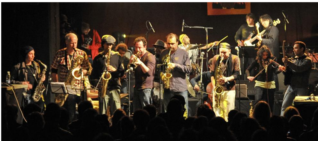
Musique Rebelle - Round 8 au Cabaret Aléatoire, Marseille - 17.04.2010

Retransmission en live sur SELF WORLD : http://www.selfworld.net/event_show/224